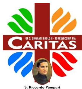
S. Riccardo Pampuri