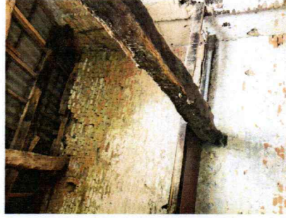
2 | REALIZZAZIONE NUOVO SOLAIO