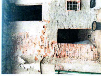
1 | RESTAURO FACCIATA