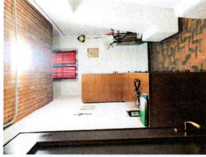
4 | REALIZZAZIONE SERVIZIO IGIENICO

IMPORTO COMPLESSIVO LAVORI: 25.000 € COMPRESIVO DI IVA