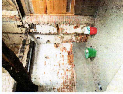
3 | REALIZZAZIONE PAVIMENTAZIONE